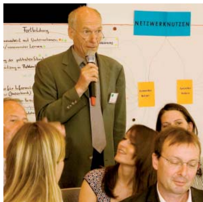
Das 3. Treffen der Hauptschulinitiative fand am 2. Juli im Nürnberger Südpunkt statt.

spezifische Stärken und die Strukturen vor Ort vorzustellen. Ausführlich diskutiert wurden auch Fragen der Qualitätssicherung und Wege der Evaluation. Im Mittelpunkt der Diskussionen am Nachmittag standen die Chancen, die sich sowohl für die Standorte als auch für die fördernden Institutionen aus einer erfolgreichen Netzwerkarbeit ergeben. Die Anforderungen für die erfolgreiche Netzwerkarbeit und die Formen der Arbeitsteilung spielten dabei eine besondere Rolle. Neben einem detaillierten Fahrplan über die weiteren Schritte zur Verdichtung des Netzwerks und der Erstellung einer gemeinsamen Internetplattform wurde ein Abschlusskommuniqué verabschiedet, das die Arbeit an einem gemeinsamen Leitbild vorbereitet. ■