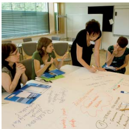
Intensiver Austausch in Kleingruppen wechselte sich mit der Diskussion im Plenum ab.