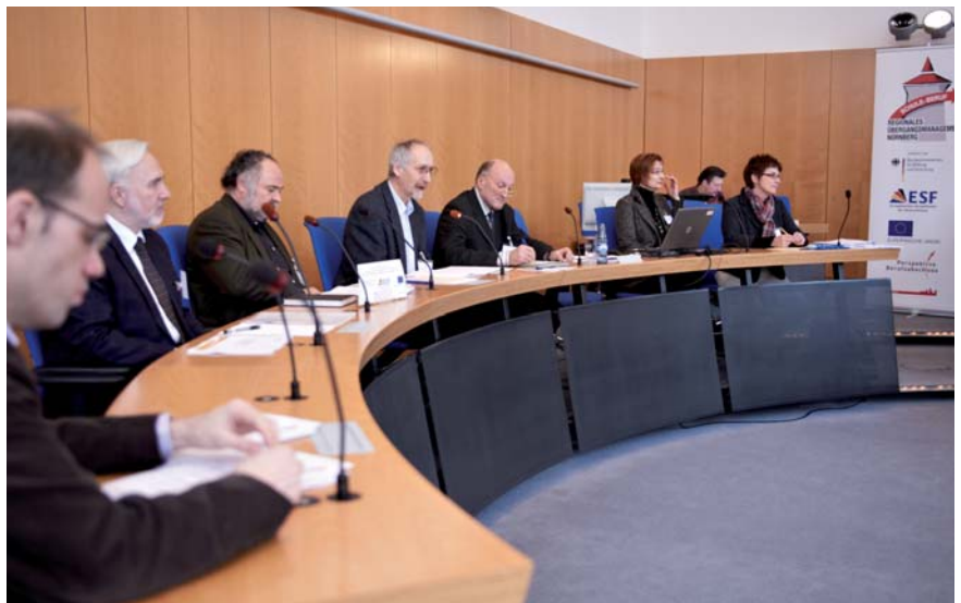
Der Nürnberger „Steuerungskreis Bildungsketten“ tagte im großen Rathaussaal in erweiterter Form.

Ausgangspunkt der Bildungskette ist eine Potenzialanalyse von Schülern ab der 7. Klasse. Auf deren Basis soll mit individuellen schulischen und außerschulischen Begleitmaßnahmen reagiert werden. Nichtschulische Begabungen und Interessen werden dabei gezielt mit einbezogen. Es handelt sich nicht um eine Analyse der Schwächen, sondern um eine Analyse der Stärken, des Potenzials des jeweiligen Schülers und der jeweiligen Schülerin. Auf dieser Grundlage kann ein individuelles Förderprogramm vereinbart werden. Dazu gehört insbesondere die Berufsorientierung. Bei Modellversuchen hat sich herausgestellt, dass Jugendliche, die in unterschiedlichen Berufsfeldern Er-