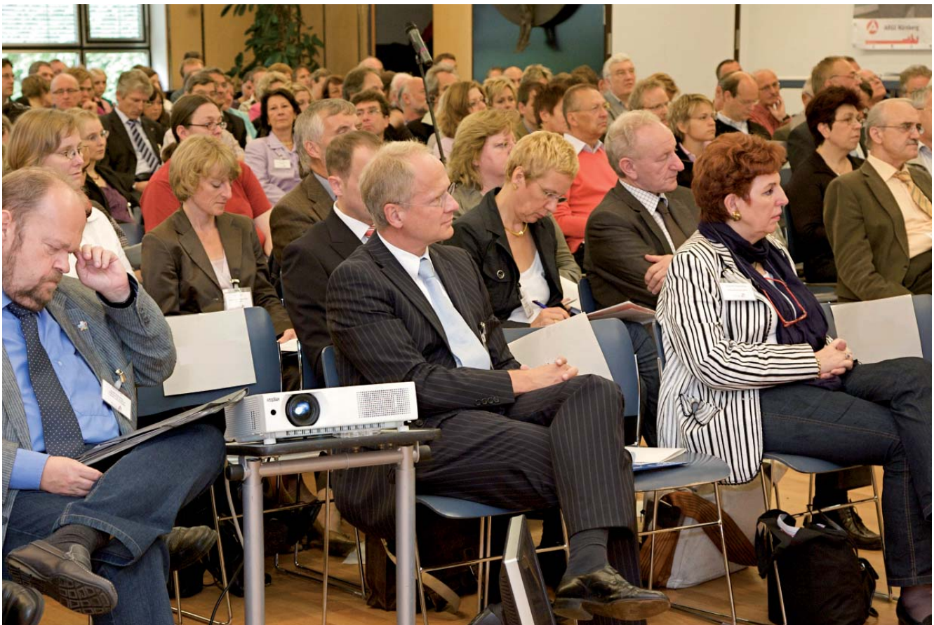
Die erste Nürnberger Bildungskonferenz besuchten über 250 Teilnehmerinnen und Teilnehmer.

rasch ändernden Anforderungen des globalen Arbeitsmarkts anzupassen und auf diese Weise eine Altersdiskriminierung zu verhindern. Berufliche Qualifikation kann nicht auf eine relativ kurze Phase zu Beginn des Lebenslaufs beschränkt bleiben, sondern ist eine lebenslange Aufgabe.“ Das Instrument der städtischen Bildungskonferenz hält er für das richtige Signal, um mehr Aufmerksamkeit für Bildung einzufordern und in der Öffentlichkeit die Schlüsselfunktion von Bildung für die Zukunftsfähigkeit bekannt zu machen. ►