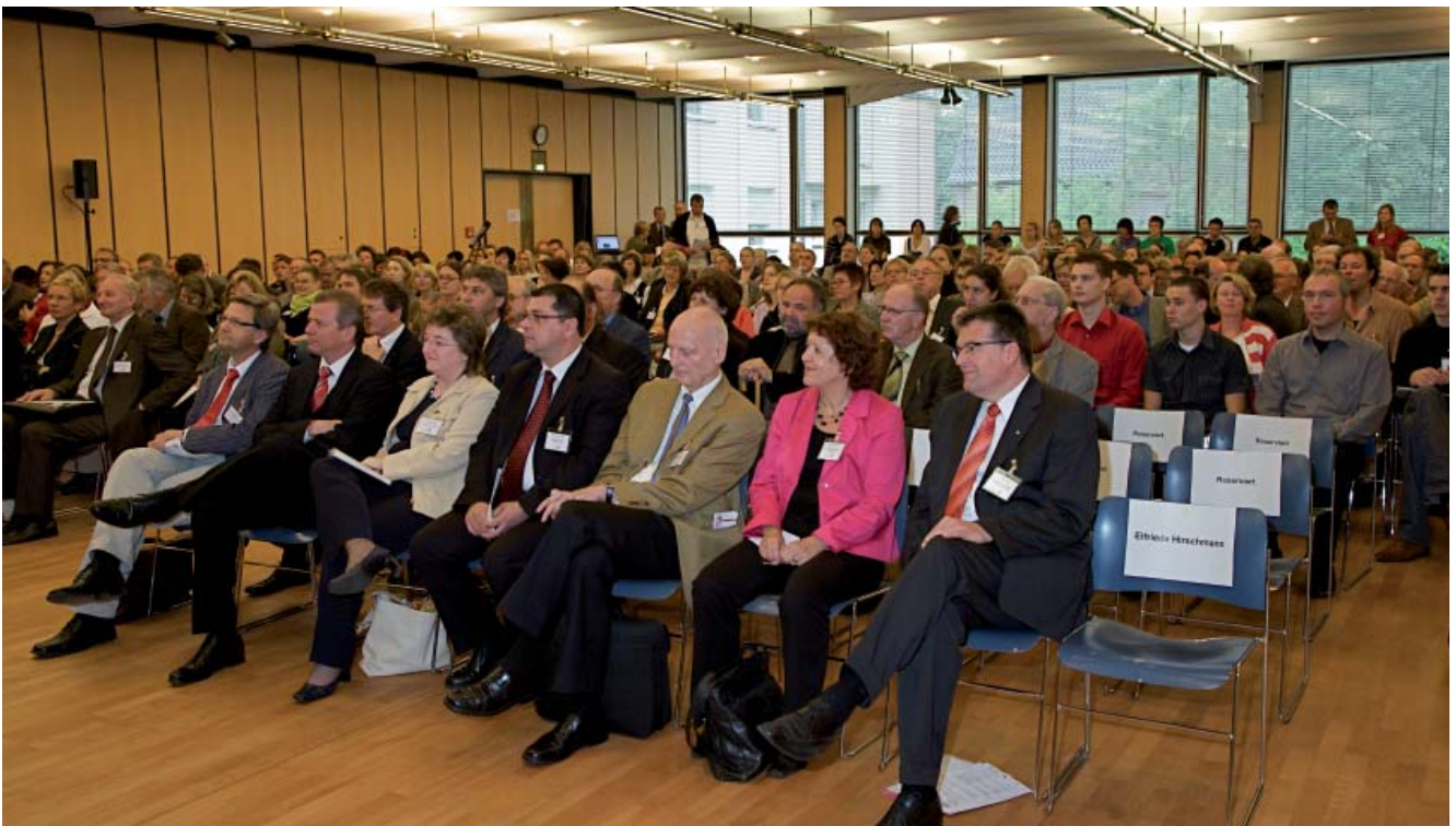
An der Nürnberger Bildungskonferenz nahmen Bildungsexpertinnen und -experten aus dem gesamten Bundesgebiet teil.

► Verantwortlichen vor einigen Jahren unabweisbar vor Augen, dass Hauptschüler in ihrem Unternehmen praktisch nicht mehr zum Zuge kamen. Hatte die Eingangsqualifikation Hauptschulabschluss im Jahr 2000 noch 10 % betragen, während 70 % mit einem mittleren Abschluss und 20 % mit Hochschulreife aufwarten konnten, verschoben sich die Anteile bis zum Jahr 2005 dramatisch: 0 % Hauptschulabschluss, 50 % mittlerer Abschluss, 50 % Hochschulreife. Nach diesem Eingeständnis wollte die Unternehmensleitung junge Menschen mit einfachem Schulabschluss gleichwohl nicht einfach abschreiben. In der Vergangenheit gesammelte positive Erfahrungen hinsichtlich Betriebstreue, Flexibilität und Einsatzbereitschaft von Hauptschulabsolventen sprachen eindeutig dagegen. Gleichzeitig war man sich im klaren darüber, dass Hauptschüler bei den verwendeten Aufnahmetests von vornherein die schlechtesten Karten hatten. Ein aussagekräftigeres Auswahlverfahren erschien angebracht.